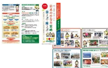
県民運動リーフレット