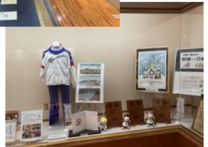
「昭和54年日本のふるさと宮崎国体展」 (県立図書館)