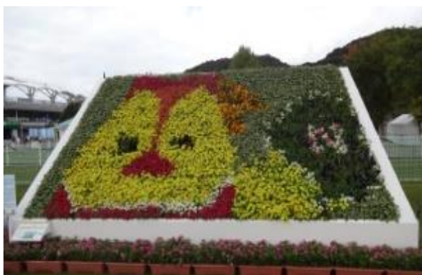
2014 長崎大会より ※写真は諫早農業高校制作 他4校が学校単位で製作し展示した。