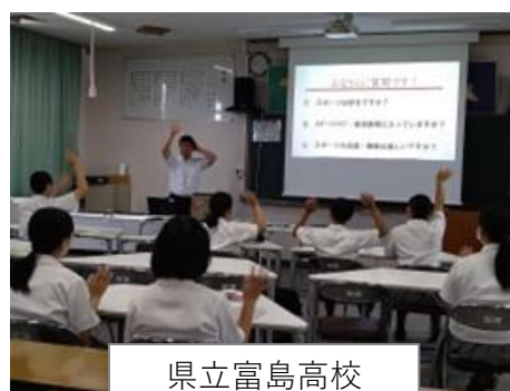
県立富島高校 出前講座