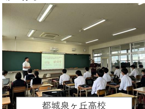
都城泉ヶ丘高校 「郷土探求分野講演会」