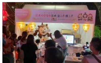
みやざきグルメとランタンナイト