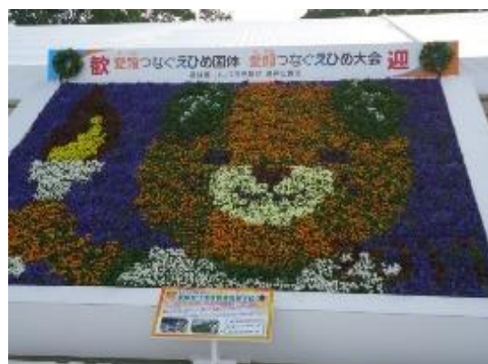
2017 愛媛大会より ※写真は伊予農業高校制作