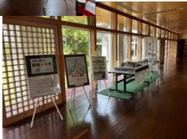
「昭和54年日本のふるさと宮崎国体展」 (県武道館)