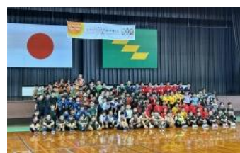
小学生バレーボール教室