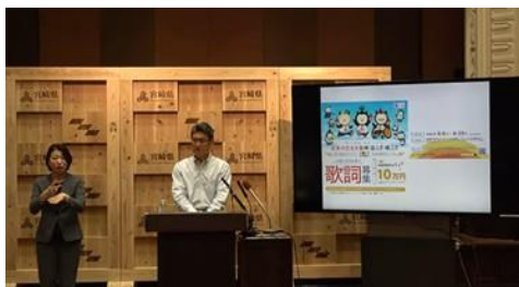
知事定例記者会見