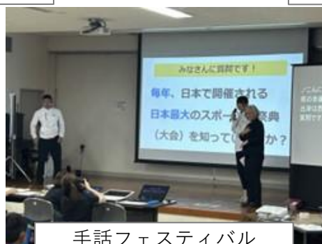
手話フェスティバル