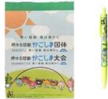
メモ帳&シャーペン 500円