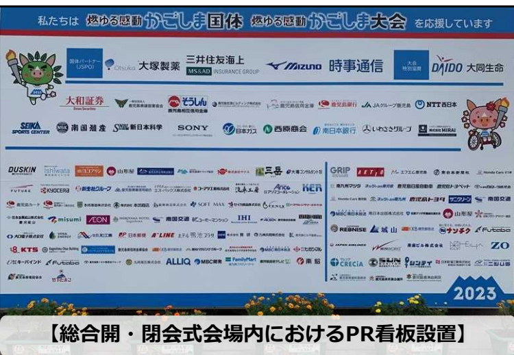
【総合開・閉会式会場内におけるPR看板設置】