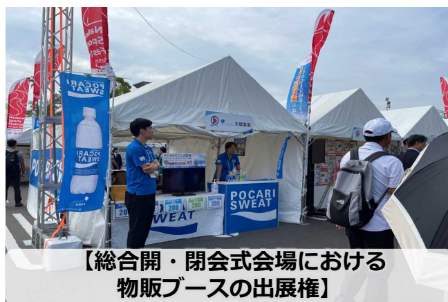
【総合開・閉会式会場における物販ブースの出展権】