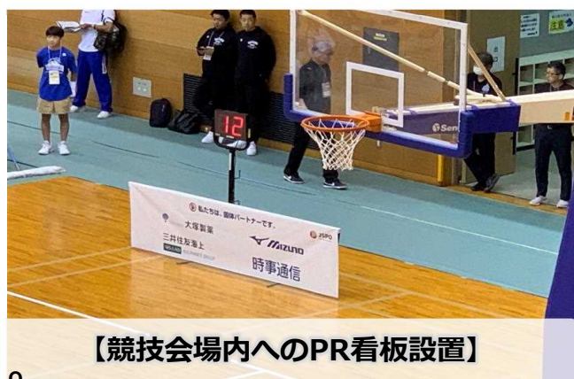
【競技会場内へのPR看板設置】