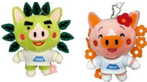
キーホルダー 各1,500円