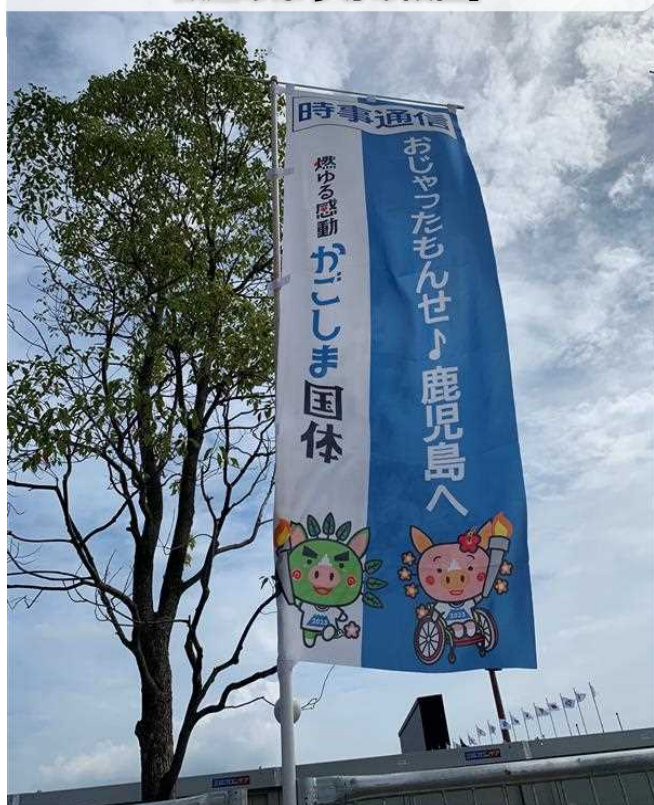
【総合開・閉会式会場周辺における 歓迎のぼり等の設置】