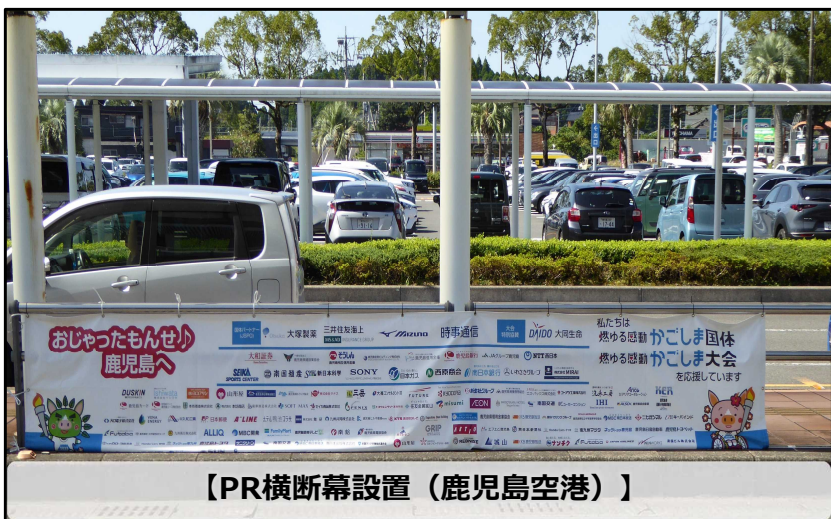
【PR横断幕設置（鹿児島空港）】