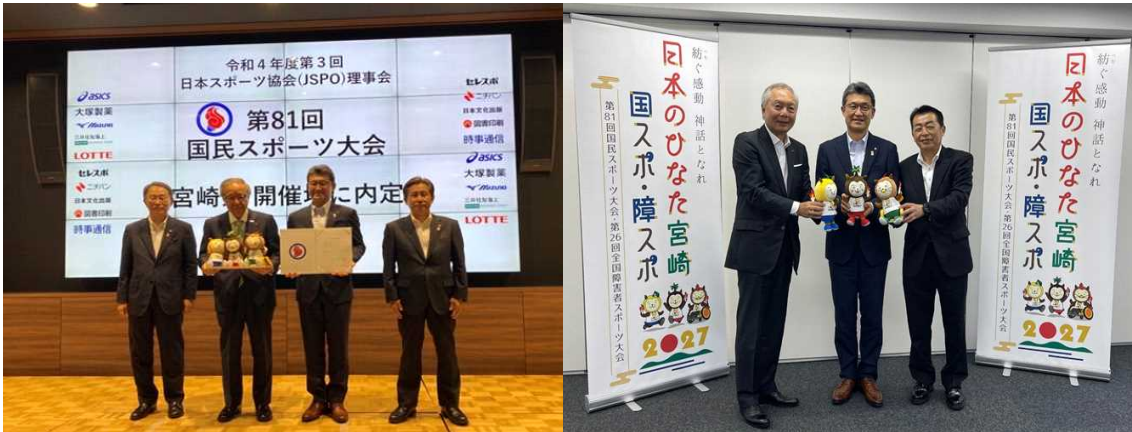
【(公財)日本スポーツ協会における記者会見の様子】