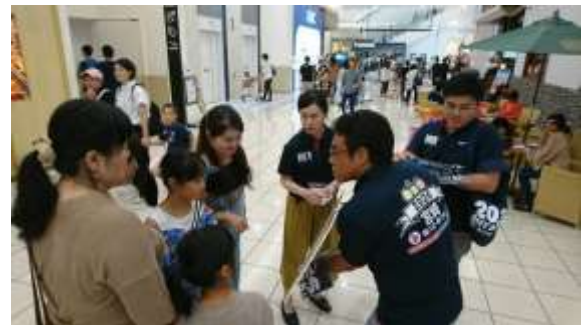
(イオンモール宮崎での広報活動)