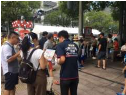
(「まつり宮崎」会場での広報活動)