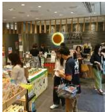
(新宿みやざき館KONNEでの広報活動)