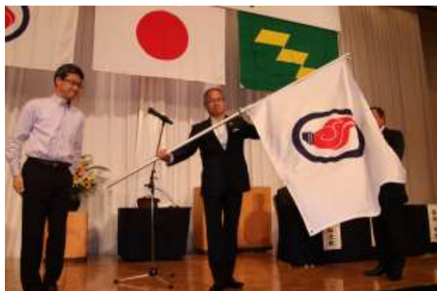
(国民体育大会旗贈呈)

また、県のマスコットキャラクターである「みやざき犬」に、大会マスコットキャラクターとしての任命証を授与