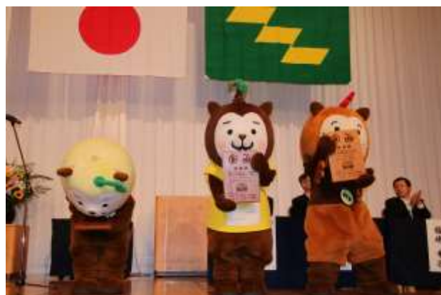
(任命証を受け取ったみやざき犬)