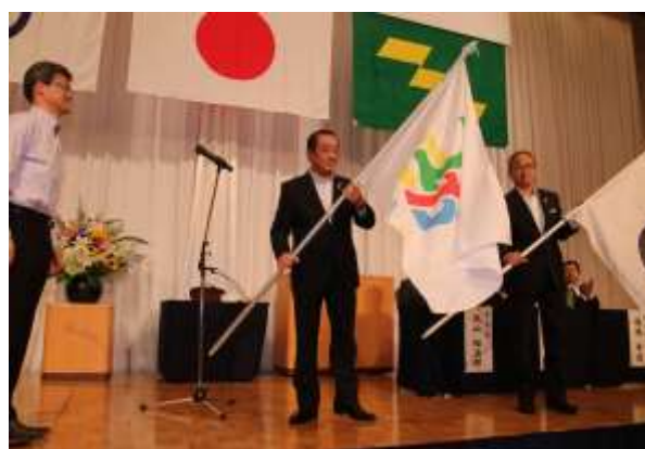
(全国障害者スポーツ大会旗贈呈)