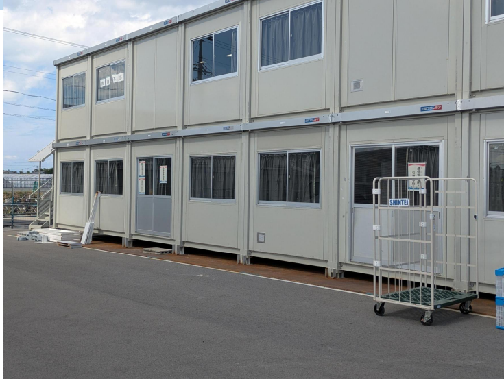
スタジアム外に救護本部設置