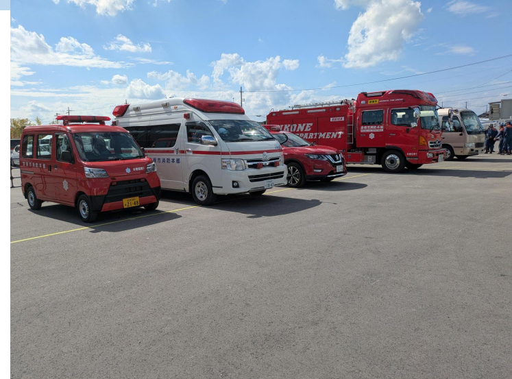
救護本部前に救急車両配備