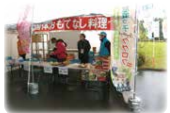
郷土料理や御当地グルメ、特産品でおもてなし