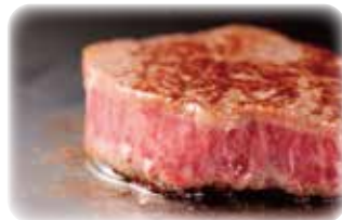
宮崎の自然や歴史、文化、食などの情報を発信