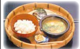
地元食材を使ったメニュー・レシピ等の発信