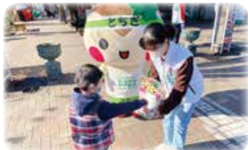
募金や協賛で大会をサポート