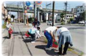
きれいな街で来県者をお出迎え(花いっぱい運動・美化活動へ参加)