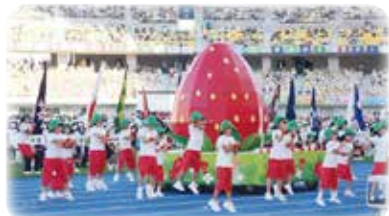
国スポ・障スポ大会開・閉会式に参加