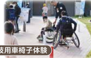
競技用車椅子体験