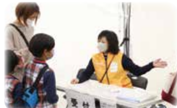
ボランティアとして大会に参加