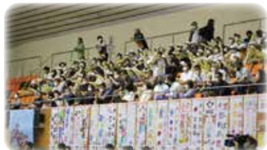
競技会場で選手を応援