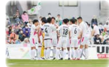
大会やスポーツキャンプの観戦、地元チームやアスリートを応援