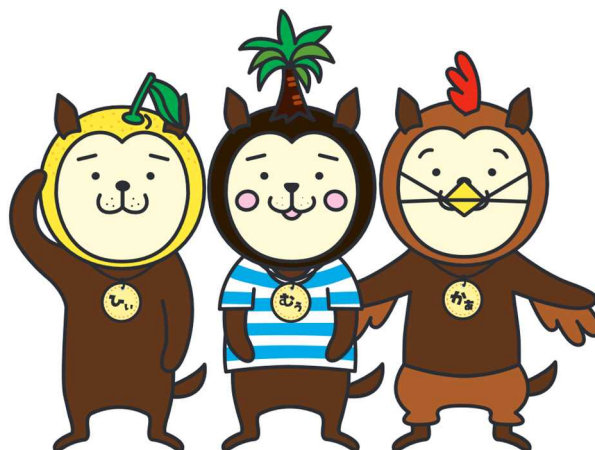
ひいくん むうちゃん かあくん