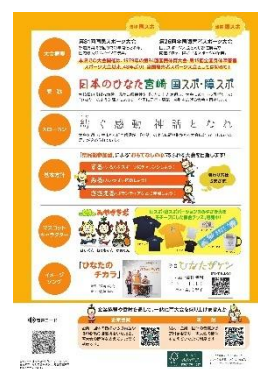
[ 4 ページ ]