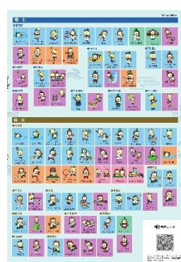
[ 3 ページ ]