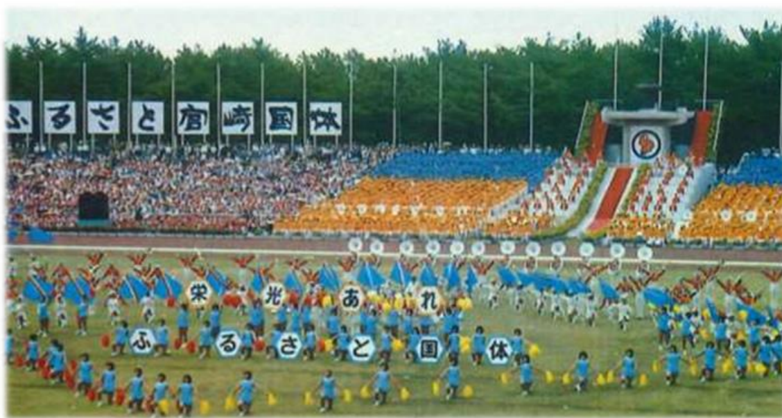
昭和54年 日本のふるさと宮崎国体 秋季大会 開会式（宮崎県総合運動公園陸上競技場）

大会マスコットキャラクターとして、開催年である「2027」をデザインしたランニングシャツを着用し、大会を象徴する炬火を掲げて、宮崎県における大会開催を県内外に広く情報発信しています。