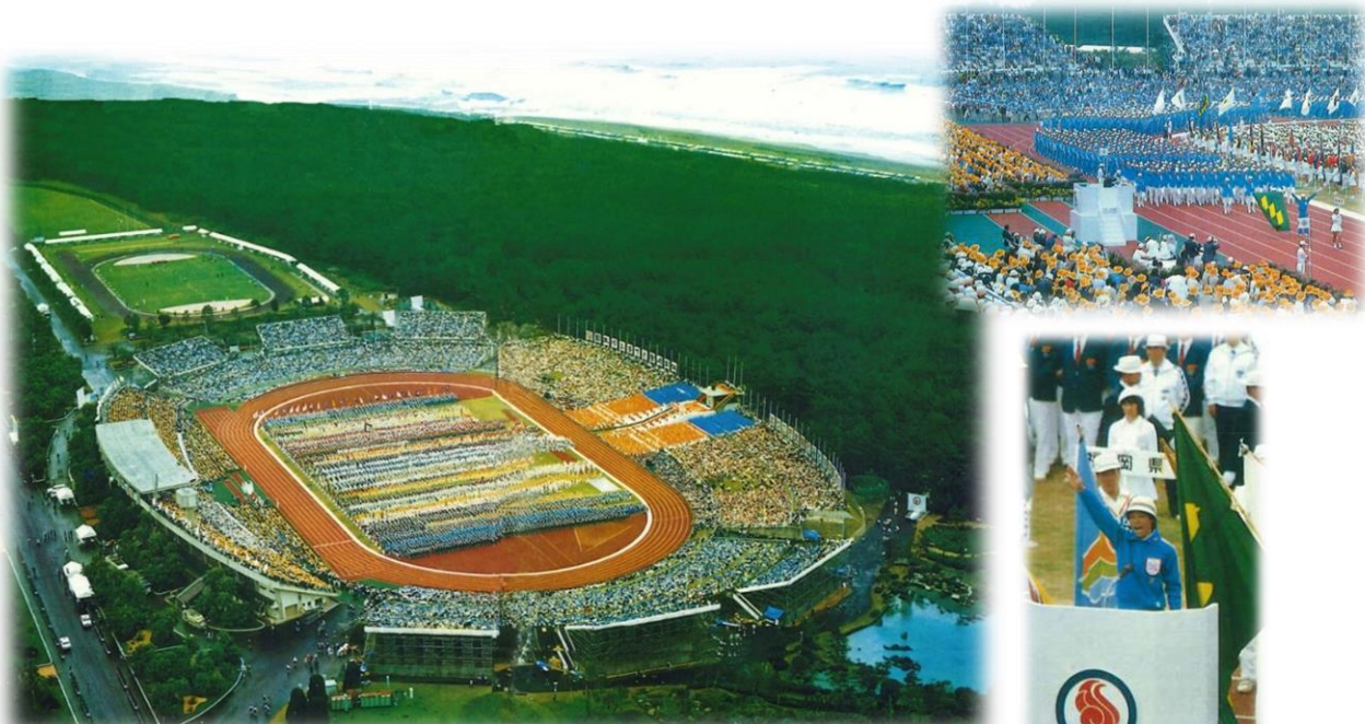
昭和54年 日本のふるさと宮崎国体 秋季大会 開会式の様子 （宮崎県総合運動公園陸上競技場）

式典基本計画は、式典基本方針や式典基本構想を踏まえ、式典の具体的な内容について基本的な考え方を明示し、式典全体の準備の円滑な推進を図るために策定するものです。