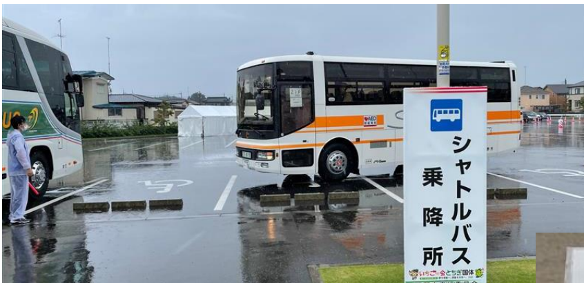
【とちぎ国体サッカー競技の例】