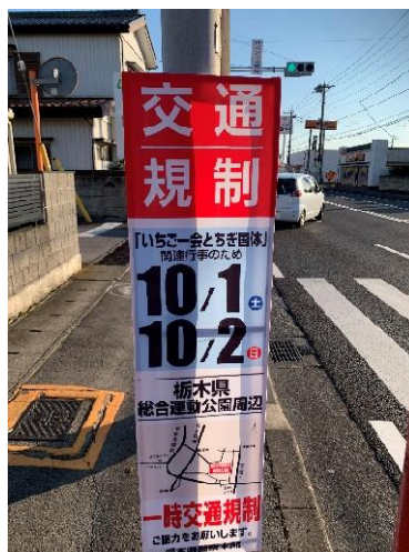
【とちぎ国体の例】 周辺住民に当日の通行自粛や交通規制を周知するチラシや看板