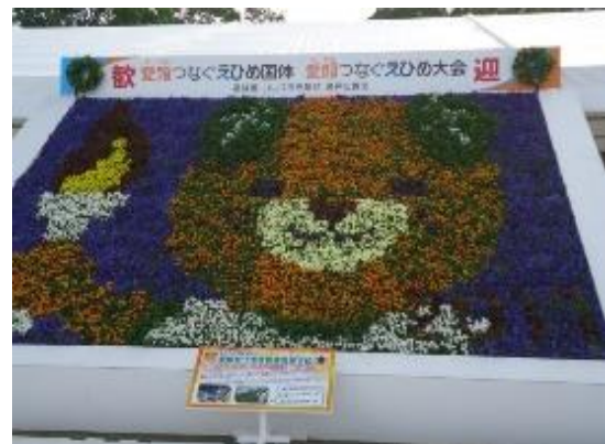
2017 愛媛大会より ※写真は伊予農業高校制作